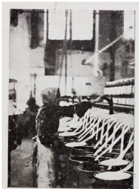
UN DETALLE DE LA ALGODONERA DE SAN ANTONIO