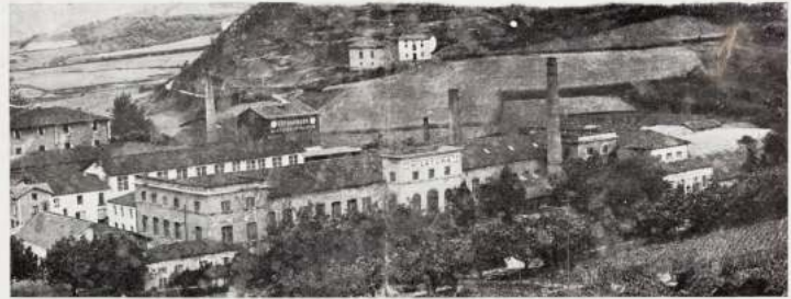
VISTA GENERAL DE LA FÁBRICA ALGODONERA DE SAN ANTONIO

Esta importante fábrica produce géneros de algodón, hilados, torcidos, tejidos, blanqueo, tintorería y estampación, pañuelos, cretonas, mahones, bombachos, blusas, etc.