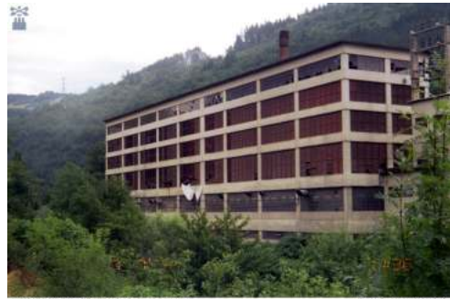
BERGARAKO UDAL ARTXIBOA. Azafuero administratiboa