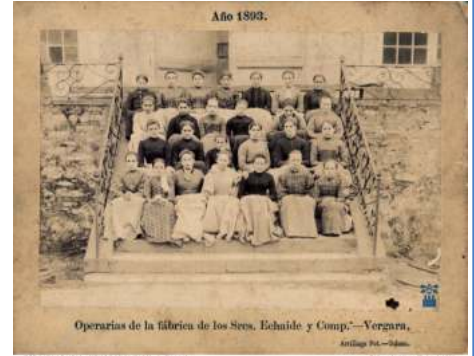
BERGARAKO UDAL ARTXIBOKO BELAZUA. E. Puyou