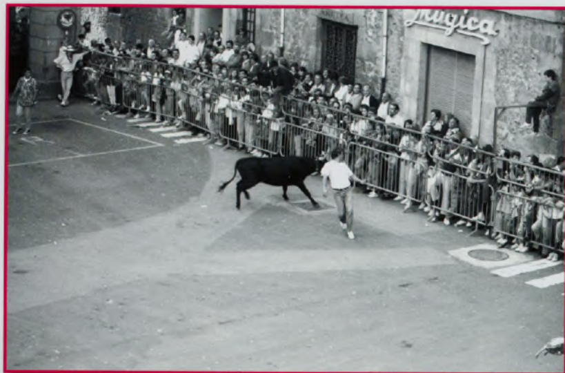
Bergarako Udal Artxiboa. B.K.E. 'ondoa (Aritz-Ondo). Egilea. ezezagunaa, 1992/06/08/