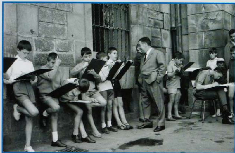
Bergarako Udal Artxiboa beldurra. (H. Azkargorta) Egilea. ezezagunra, 1960 ingurukoa

XXVIII CONCURSO DE PLÁSTICA PARA NIÑO/AS Y JÓVENES, organizado por la Asociación de arte Beart de Bergara, en la plaza San Martín. En caso de lluvia, se realizará en la sede de Beart, en Bolu 49.