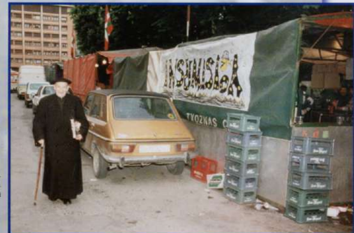
Begarako Udal Artxiboa. B.K.E. fondoa (Ariz-Ondo). Egilea: ezezaguna, 1991ko maitza