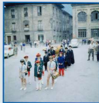
Bergarako Unai Artxiboa. Juan Idigoras fondoa. Egilea Juan Idigoras Irala. 1970/06/30

Ondoren herriko plazan elkartuko dira guztiak eta Mizpirualdera egingo dute bisita.