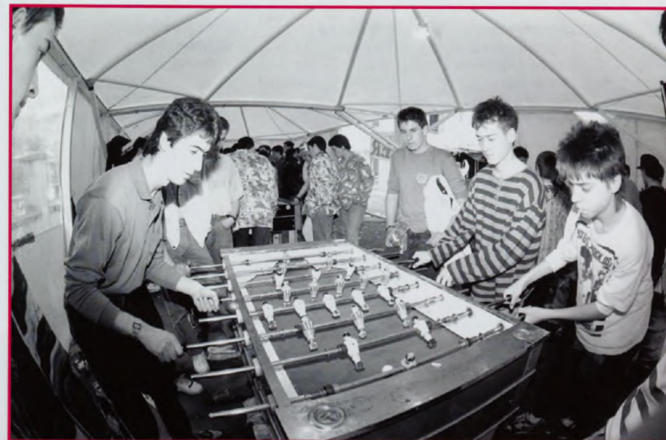
Bergarako Udal Artxiboa. B.K.E. 'ondoa (Aritz Ondo). Egilea. ezezagunaa, 1991/05/19/