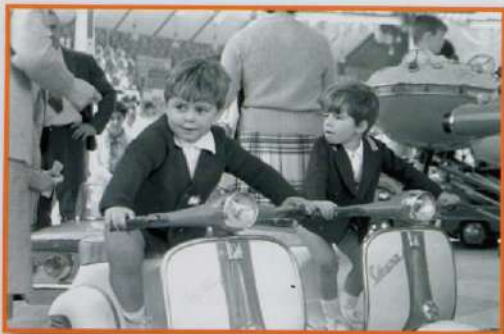
Bergarako Udal Artxiboa. Roman Larrañaga fondoa. Egilea: Roman Larrañaga, 1972 ingurukoa

Al anochecer, APERTURA DE BARRACAS en Matxiategi y APERTURA DE TXOSNAS en Bideberri.