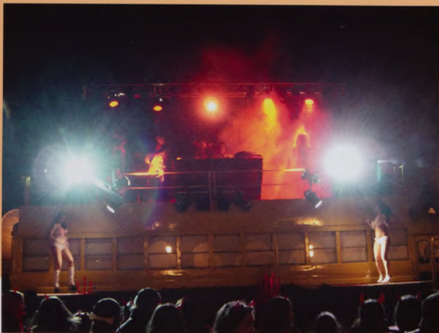
Pixpila disko-busekoek saltsa eta piperra ekarriko dute San Martin plazara.

20:00 Jaien hasiera, etxafleroak jaurtitzea eta BITORIANATXOREN JAITSIERAREKIN, San Martin plazan.