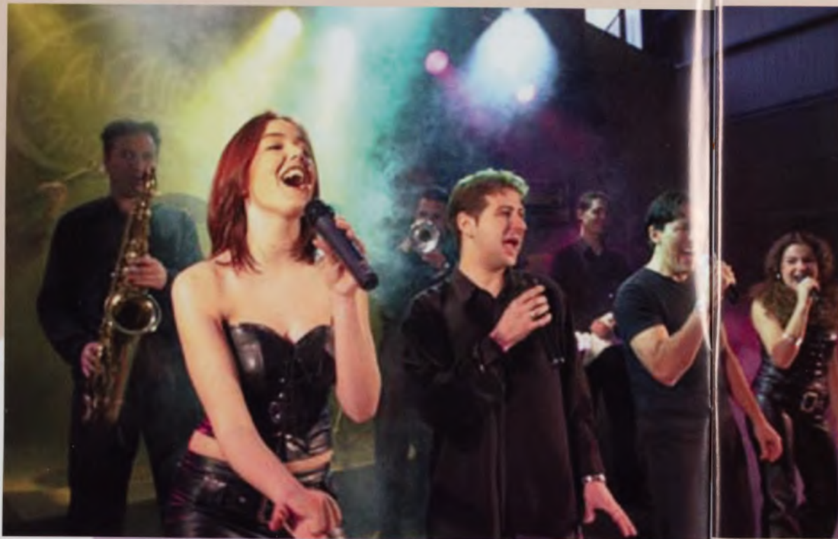
Tarantella taldekoek zure dantzarako grina kanporatuko dizute.

08:00 SOKAMUTURRA San Martín plazan, Elgoibarko dultzaineroek animatuta.