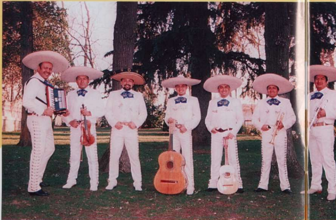
Mexikoko kantu tradizionalak ere izango dute beren tokia Pentekosteetan Mariachi Garibaldi taldekoekin.

08:00 SOKAMUTURRA San Martin plazan eta Barrenkalen, Elgoibarko dultzaineroek eta Incansables txarangak animatuta.