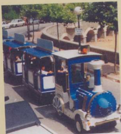
Txu-txu trenean ez ezik, saltoka ibiltzeko aukera ere izango da umeen egunean.