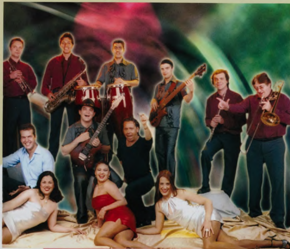
Montesblancos taldearekin dantza latindarren topagune bihurtuko da San Martin plaza.

09:00 XXV.HAUR ETA GAZTEEN PLASTIKA-SARIKETA , Beart Bergarako Arte elkarteak antolatuta, Bolu kaleko egoitzan. (Bolu 49)