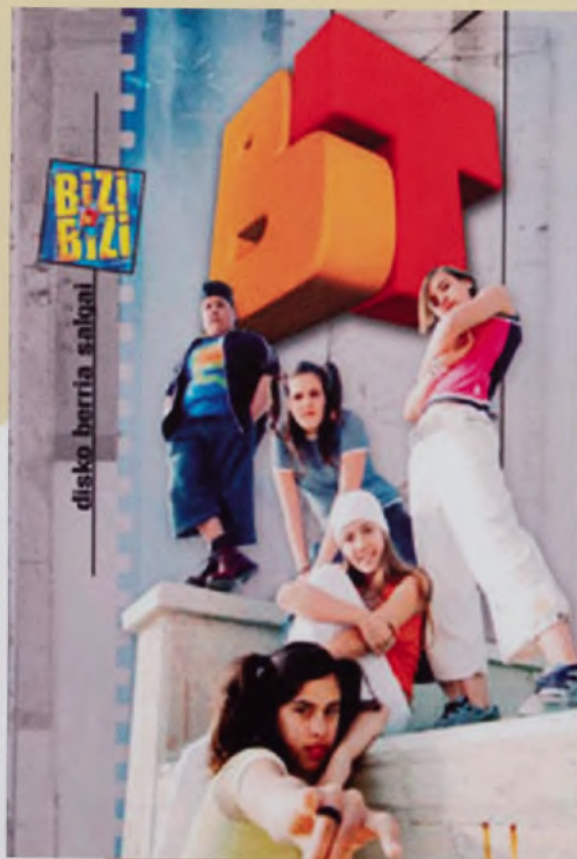
Betizukoak, telebistatik Bergarara.

Recorrido turístico por el municipio con el TREN LOCAL, con salida en Fraiskozuri.