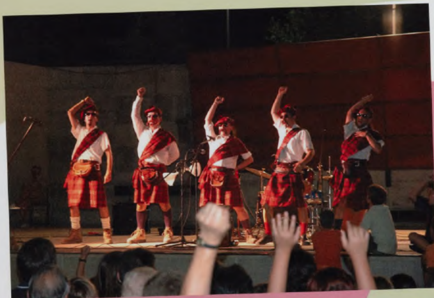
Eskoziarrek ere ez dituzte Pentekoste jaiak galduko.

Recorrido: Plaza San Martín, Bidekurutzeta, Ramón María Lili, Ibargarai, plaza Fraiskozuri, paseo Irizar, Barrenkalea y plaza San Martín.