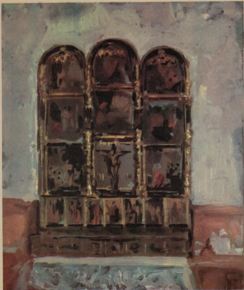
POLIPTICO DE LA SACRISTIA DE LA PARROQUIA DE SAN PEDRO APOSTOL