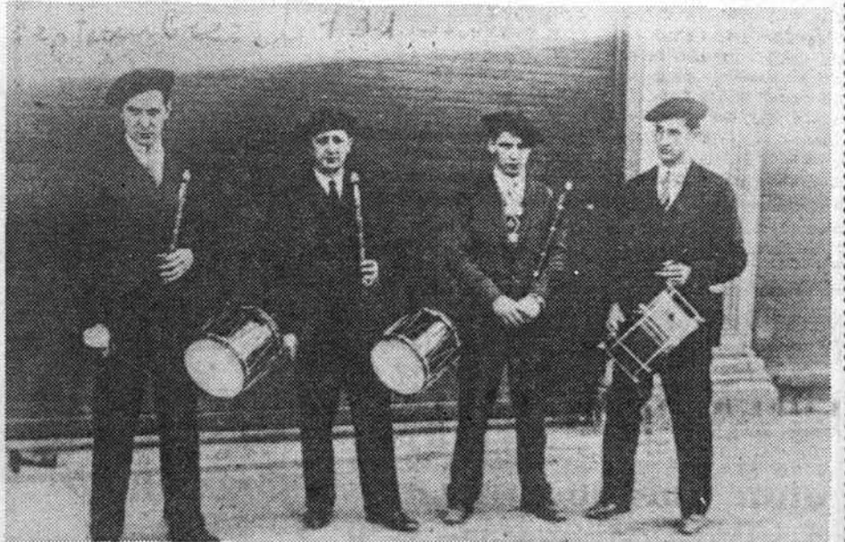
Los componentes de la banda de txistularis bergarésa, que obtuvo el premio.

CARTELERA CINE IRALA: 7,30 y 10,15. «Las evadidas». SALON NOVEDADES: 7,30 y 10,15. «El nido».