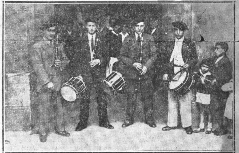
LAS DOS MERECIERON EL PRIMER PREMIO EN EL CONCURSO DE "TXISTULARIS", PORQUE EL JURADO NO ENCONTRO DIFERENCIAS EN SUS MERITOS.

tanto que el público tributó a los pequeños "txistularis" una ovación de simpatía.