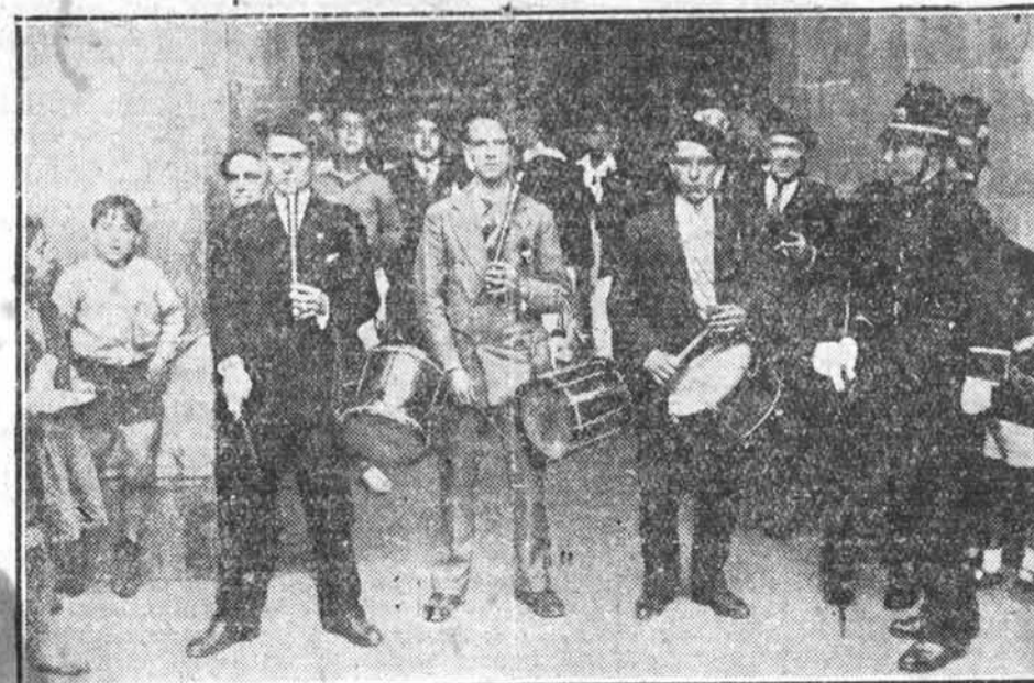
EN LA SERIE C, OBTUVO EL PRIMER PREMIO.