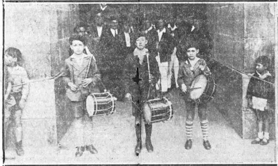
Muchachitos tolosanos, que llamaron grandemente la atención y obtuvieron el segundo premio de su serie.

Dos primeros premios, de 700 pesetas cada uno, sin distinción, a las bandas de Vergara y de Rentería.